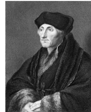
Erasmus of Rotterdam 1466 - 1536